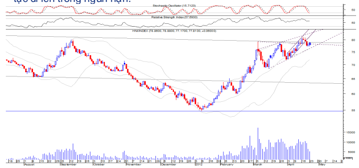
Đồ thị ngày chỉ số HNX-Index

Cây nến xanh đặc hình thành ngay gần đường xu xu thế tăng ngắn hạn của chỉ số Hnx-Index khi kết hợp với tín hiệu từ chỉ báo ngắn hạn Stochastic Oscillator đã xuống vùng tín hiệu mua trong ngắn hạn (trong trạng thái đường 5 ngày đang có tín hiệu hội tụ với đường 3 ngày) và sự suy giảm rõ rệt Volume cho thấy xuất hiện sự hấp thụ cung khá tốt của chỉ số Hnx-Index, phát tín hiệu tăng trở lại trong ngắn hạn và tín hiệu này đang dần xác nhận bước giảm điểm vừa qua của chỉ số Hnx-Index là một bước điều chỉnh gần 50% của quá trình tăng zigzag vừa qua để tiếp tục đi lên trong ngắn hạn.