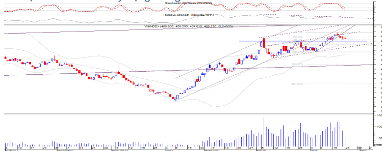
Đồ thị ngày chỉ số VN-Index

Hai cây nến dạng "Doji Star" có giá đóng cửa gần bằng nhau cùng sự suy giảm của Volume sau 4 nến đỏ giảm 38,2% của bước sóng tăng vừa qua cho thấy tín hiệu hấp thụ cung khá tốt đang diễn ra trên đồ thị chỉ số VN-Index, chỉ báo ngắn hạn Stochastic Oscillator chưa về dưới vùng tín hiệu mua nhưng đã giảm về khá gần vùng này làm xuất hiện kỳ vọng sự phục hồi sớm trở lại, điểm đáng chú ý là sự suy giảm Volume cùng 2 cây nến dạng "Doji Star" vừa qua trong lịch sử thường là tín hiệu tạo đáy trong ngắn hạn với độ tin cậy cao, những tín hiệu trên đang ủng hộ cho quan điểm sự suy giảm vừa qua là một bước điều chỉnh sau quá trình tăng bền vượt mẫu hình tích lũy dạng tam giác cấu trúc 3-3-3.